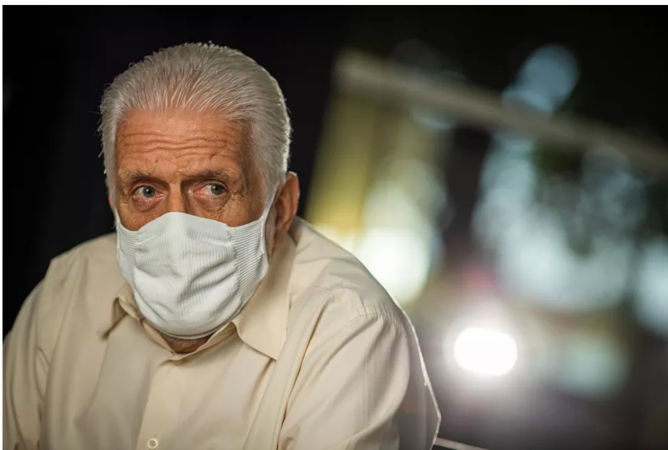
Jaques Wagner, senador.

Wagner vinha figurando bem atrás do adversário ACM Neto (União Brasil) nas pesquisas de intenção de voto. "A retirada da minha candidatura não implica na retirada da candidatura do PT. Quem decidirá se terá candidatura ou não não sou eu, será o Partido", afirmou Wagner, em nota.