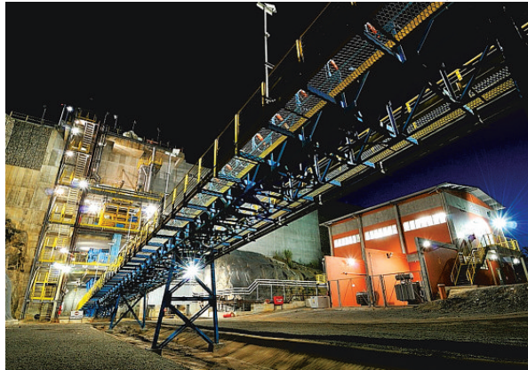
Bahia encerrou 2021 como 3º maior produtor do país e já iniciou o ano bem