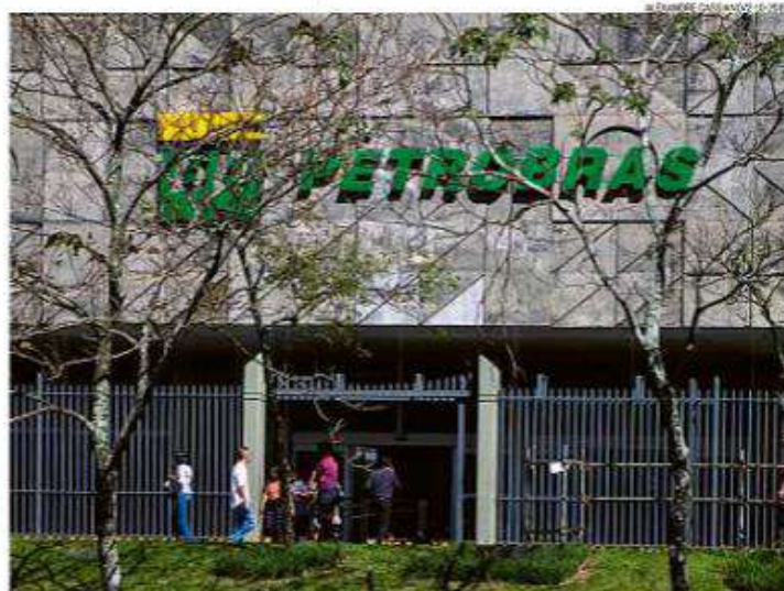
Estabilidade nas ações. Papéis da companhia em Nova York, as ADRs, subiram 0,14%, na negociação após fim do pregão

Um outro executivo do setor de petróleo, que pediu para não ser identificado, afirmou que José Mauro tem conhecimento da área, com ampla passagem pelo setor público, mas não tem experiência na condução de empresas, sobretudo de uma estatal de grande porte e com-