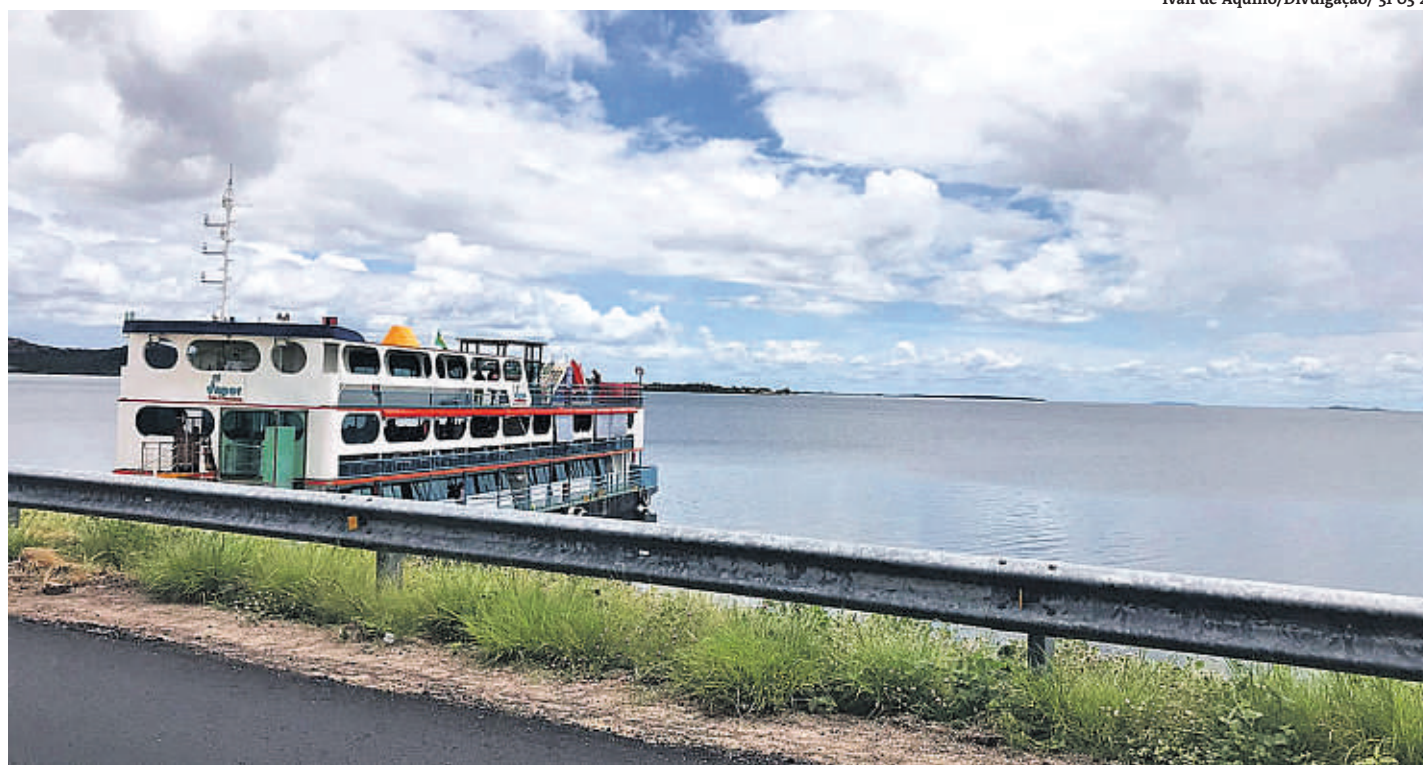
31 03 22

Na semana passada, o Lago do Sobradinho teve o nível de água elevado por conta das chuvas