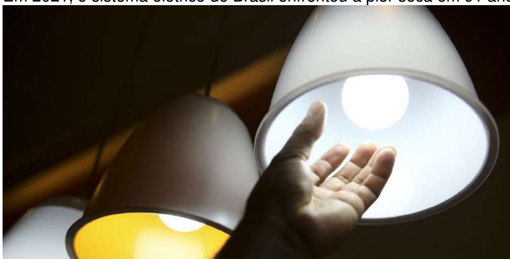
Por Redação no dia 06 de abril de 2022 às 10:43

Em 2021, o sistema elétrico do Brasil enfrentou a pior seca em 91 anos